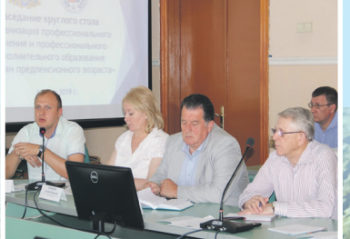
Круглый стол по защите прав предпенсионеров