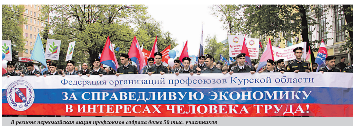
В регионе первомайская акция профсоюзов собрала более 50 тыс. участников

Завершилась демонстрация молодежным студенческим флешмобом, организованным профсоюзами региона, и концертом творческих коллективов на Красной площади.