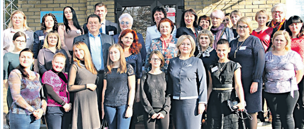
Проведены конкурсы «Лучший по профессии»: токарь, фрезеровщик, водитель, сварщик, швея