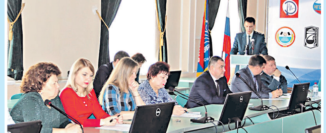
Участие в публичных слушаниях правоприменительной практики налоговых органов, Госинспекции труда