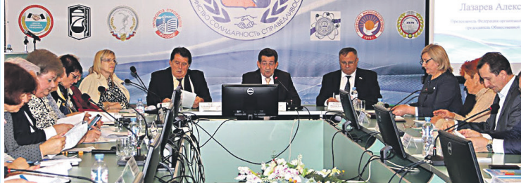
Заседание трехсторонней комиссии по регулированию социально-трудовых отношений в рамках Всемирного дня действий профсоюзов «За достойный труд».