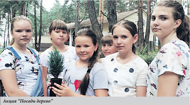
Акция «Посади дерево»