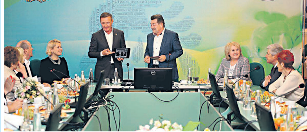
Чествование трудовых династий в Доме профсоюзов с участием губернатора Курской области Романа Старовойта