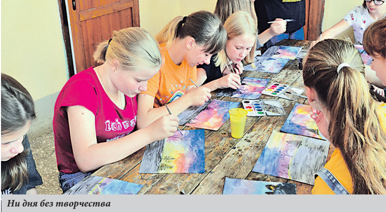
Ни дня без творчества