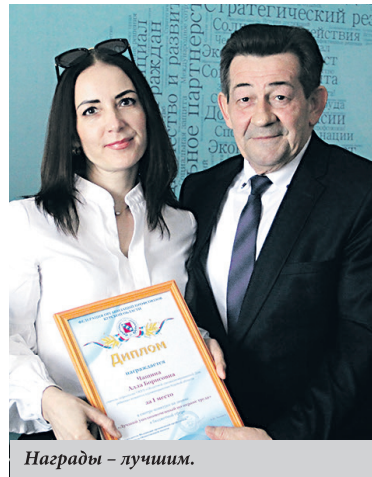
Награды – лучшим.

29 АПРЕЛЯ состоялась областная конференция, посвященная Всемирному дню охраны труда. В этом году ее основная тема: «Охрана труда и будущее сферы труда».