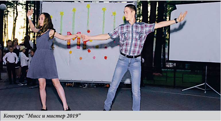
Конкурс «Мисс и мистер 2019»