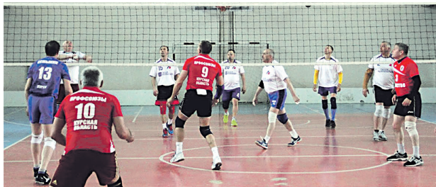
Победитель турниров волейбольная команда Федерации профсоюзов «Единство»