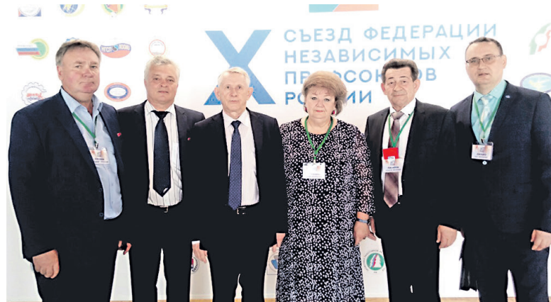
Делегаты X съезда ФНПР от Курской области, 2019 г.