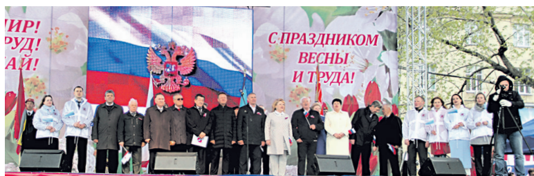
День международной солидарности трудящихся!