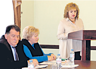
Круглый стол «Наставничество – инвестиция в долгосрочное развитие организации»