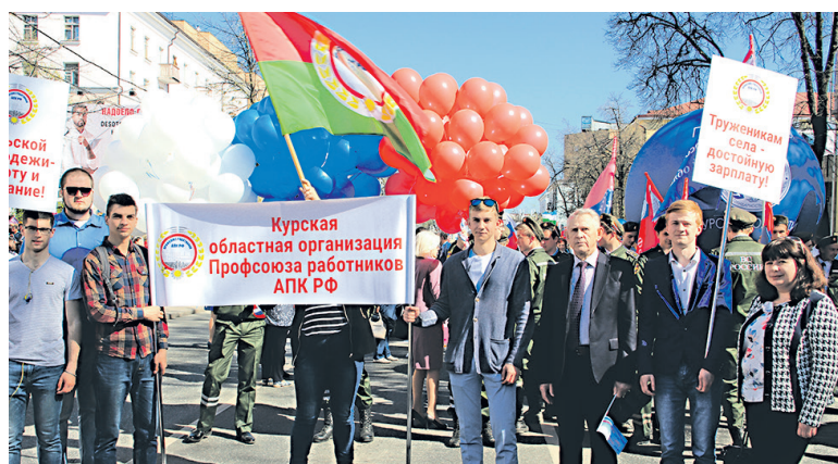
1 мая 2018 г.

А что касается изменений, то пусть они будут только в лучшую сторону, пусть возрастают размеры стипендий, увеличивается количество путевок на отдых и оздоровление, пусть еще больше становится призеров на смотрах-конкурсах и спартакиадах, пусть при нашем непосредственном участии обретают новое дыхание аграрный сектор и социальная сфера на селе.