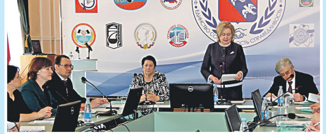
Работа выборных коллегиальных органов: проведено 2 заседания Совета Федерации, 7 заседаний президиума