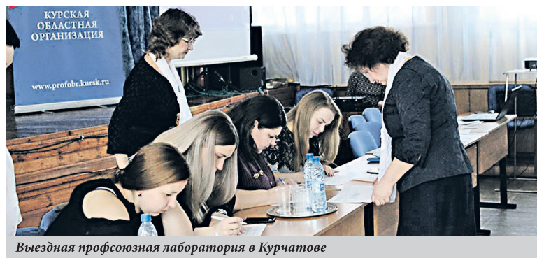
Выездная профсоюзная лаборатория в Курчатове