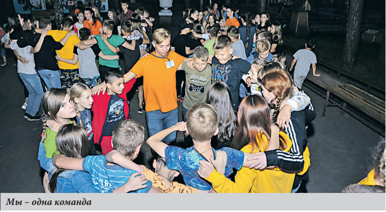
Мы – одна команда