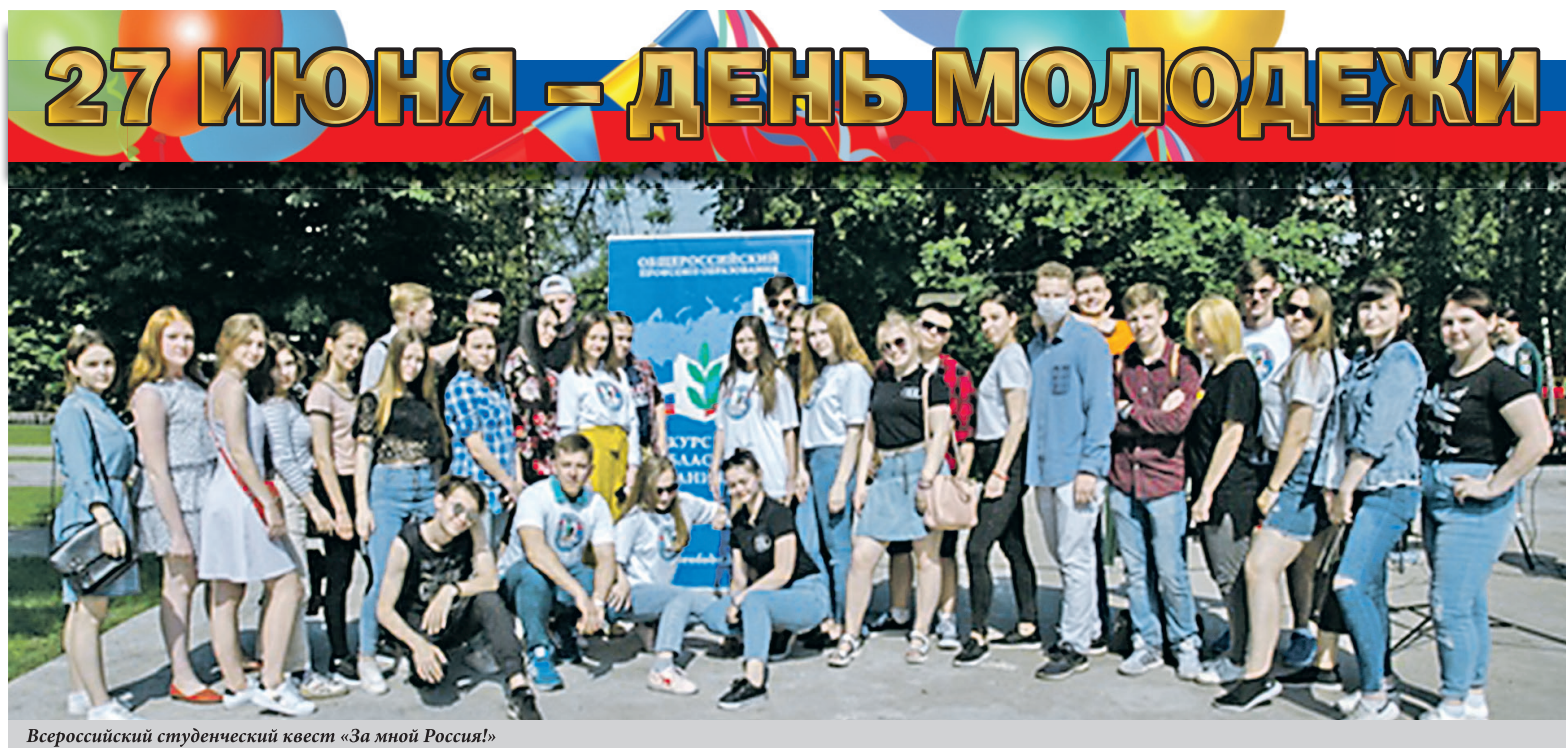
Всероссийский студенческий квест «За мной Россия!»