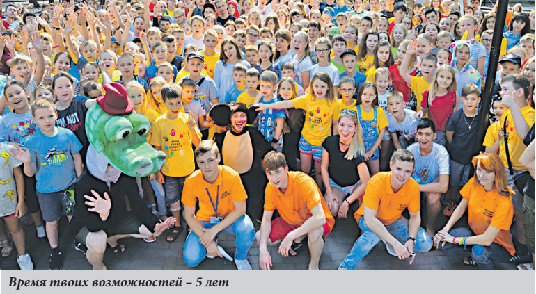
Время твоих возможностей – 5 лет