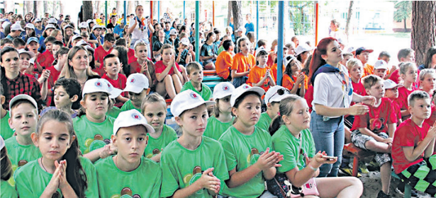
В профсоюзных профильных сменах отдохнуло более 700 детей