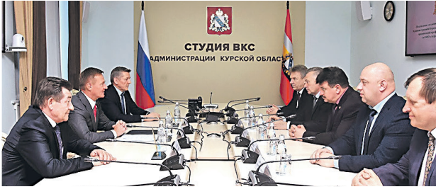
Подписано более 20 соглашений о сотрудничестве с руководителями предприятий и организаций области