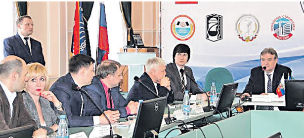
Встреча профсоюзов с делегацией Республики Молдова