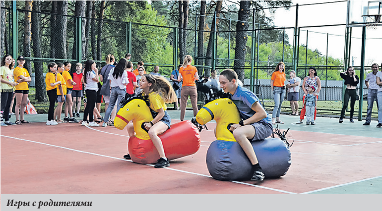
Игры с родителями

Вожатые обещают: каждый новый день для мальчишек и девочек будет интересным, полезным и, главное, поможет раскрыть себя.