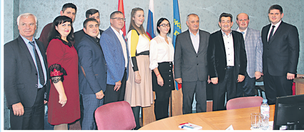
В региональном этапе конкурса «Молодой профсоюзный лидер – 2019» приняли участие 8 конкурсантов