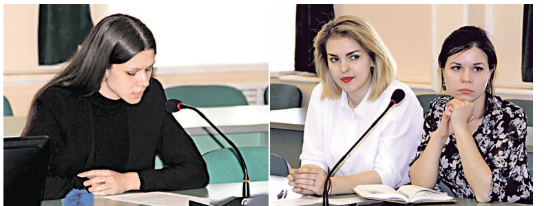
Ставка профсоюзов – на молодежь!

Завершилось заседание Молодежного совета Федерации организаций профсоюзов трансляцией ролика, подготовленного по итогам первого этапа Фестиваля работающего молодого «Юность-2019».