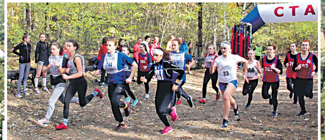
Традиционный легкоатлетический кросс профсоюзов