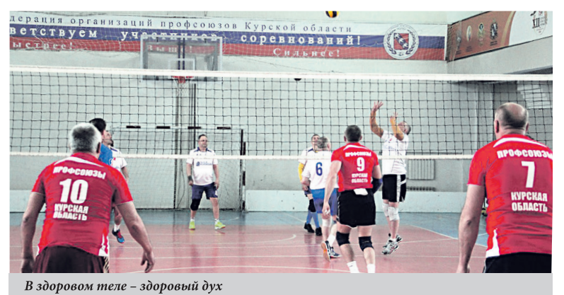
В здоровом теле – здоровый дух