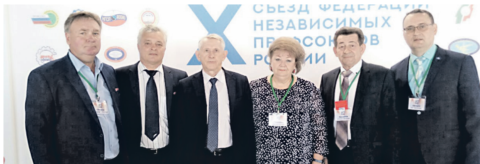
Представители профсоюзов Курской области на X съезде ФНПР

С материалами X съезда ФНПР можно ознакомиться на сайте Федерации организаций профсоюзов Курской области ( profkursk.ru )