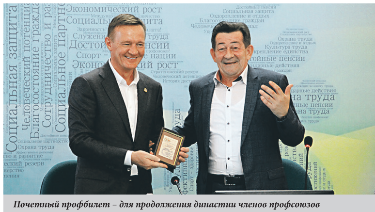
Почетный профбилет – для продолжения династии членов профсоюзов

25 АПРЕЛЯ в Доме профсоюзов состоялось знаменательное событие – чествование представителей лучших трудовых династий.