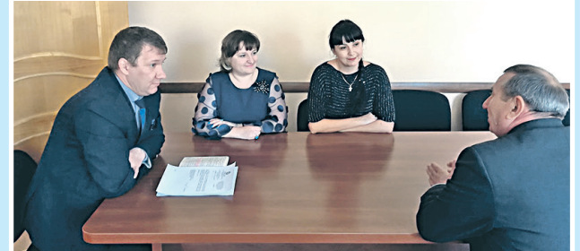
Даны более 2 тыс. консультаций по вопросам соблюдения ТЗ