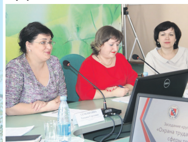
Профсоюзная сессия в честь 100-летия МОТ