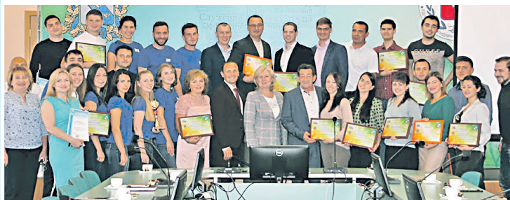
Фестиваль работающей молодежи «Юность»