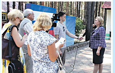
Работа профсоюзов освещалась региональными СМИ: 48 печатных публикаций, 23 видеосюжета