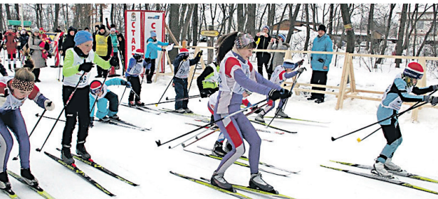
Первенство ФОПКО по лыжному кроссу собрало более 600 человек