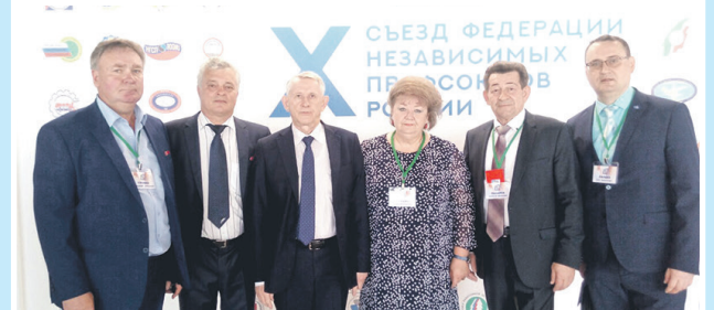
Делегаты X съезда ФНПР от Курской области