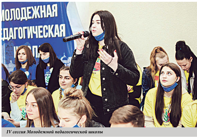
IV сессия Молодежной педагогической школы

В заключение хочу еще раз поблагодарить руководителей органов власти региона за поддержку системы образования, ее работников, коллег – за подвижнический труд, поздравить всех с Днем знаний, началом учебного года и выразить надежду, что вместе мы справимся с проблемами. Мы просто не имеем права не сделать это! И главное – будьте здоровы!