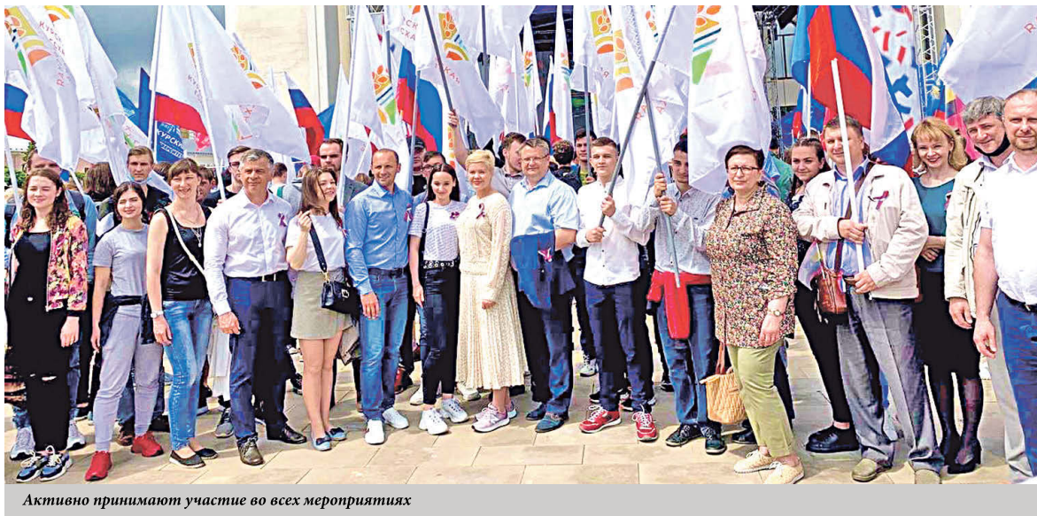
Активно принимают участие во всех мероприятиях

Курская государственная сельскохозяйственная академия – вуз с 70-летней историей. Более 50 тысяч выпускников стали кадровой основой АПК Курской области и других регионов России. В их числе почти половина глав районов области, руководители многих агропредприятий и компаний. Не только аграрное, но и инженерное, а также экономическое образование в нашем регионе начиналось именно в Курской ГСХА.