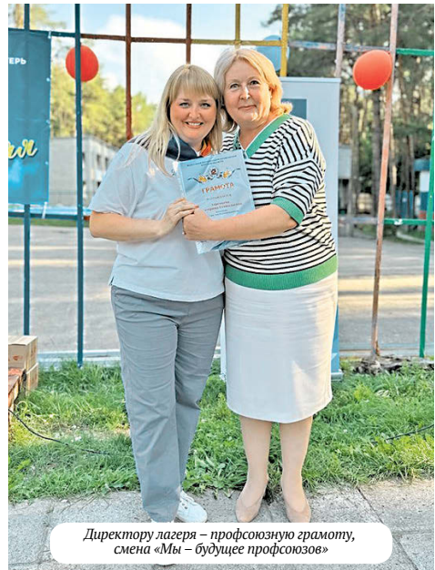
Директору лагеря – профсоюзную грамоту, смена «Мы – будущее профсоюзов»