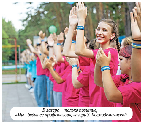
В лагере – только позитив, «Мы – будущее профсоюзов», лагерь З. Космодемьянской