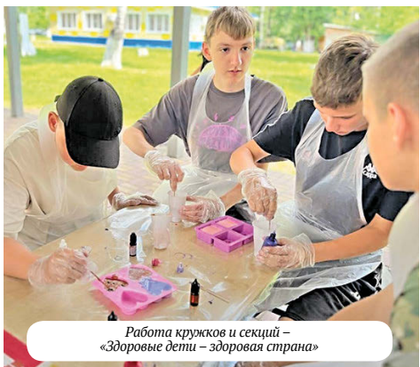
Работа кружков и секций – «Здоровые дети – здоровая страна»