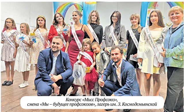
Конкурс «Мисс Профсоюз», смена «Мы – будущее профсоюзов», лагерь им. З. Космодемьянской