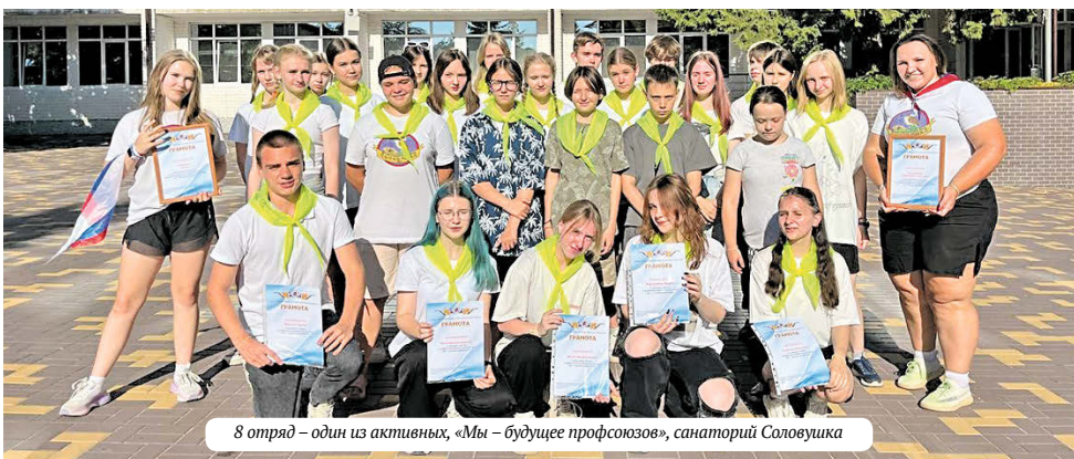
8 отряд – один из активных, «Мы – будущее профсоюзов», санаторий Соловушка