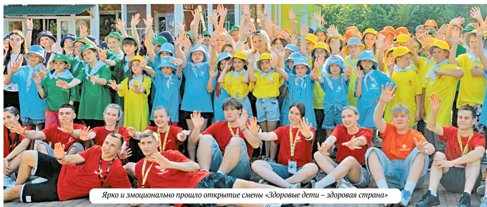
Ярко и эмоционально прошло открытие смены «Здоровые дети – здоровая страна»