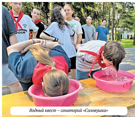
Водный квест – санаторий «Соловушка»