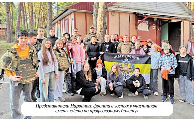
Представители Народного фронта в гостях у участников смены «Лето по профсоюзному билету»