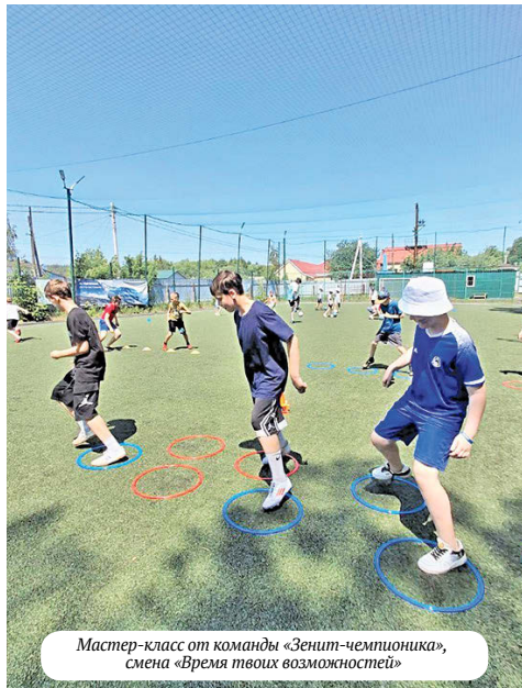
Мастер-класс от команды «Зенит-чемпионика», смена «Время твоих возможностей»