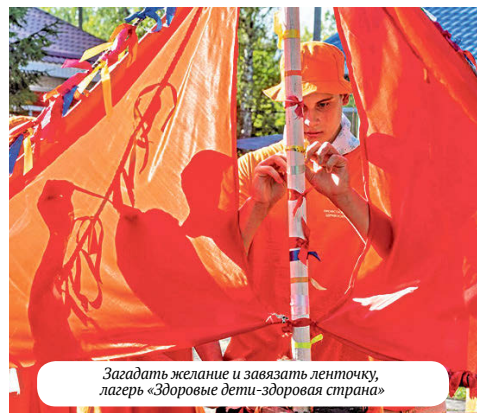
Загадать желание и завязать ленточку, лагерь «Здоровые дети-здоровая страна»

Главный редактор: Е.М. Бобрышева Учредитель: Союз «Федерация организаций профсоюзов Курской области» Адрес редакции, издателя: 305001, г. Курск, ул. Дзержинского, 53, оф. 36 Телефон: 54-88-16 e-mail: fruko@mail.ru