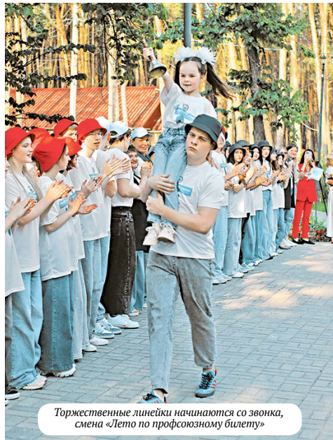
Торжественные линейки начинаются со звонка, смена «Лето по профсоюзному билету»