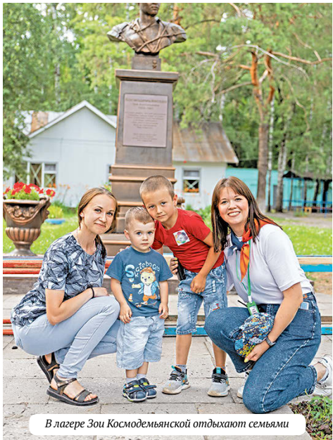
В лагере Зои Космодемьянской отдыхают семьями